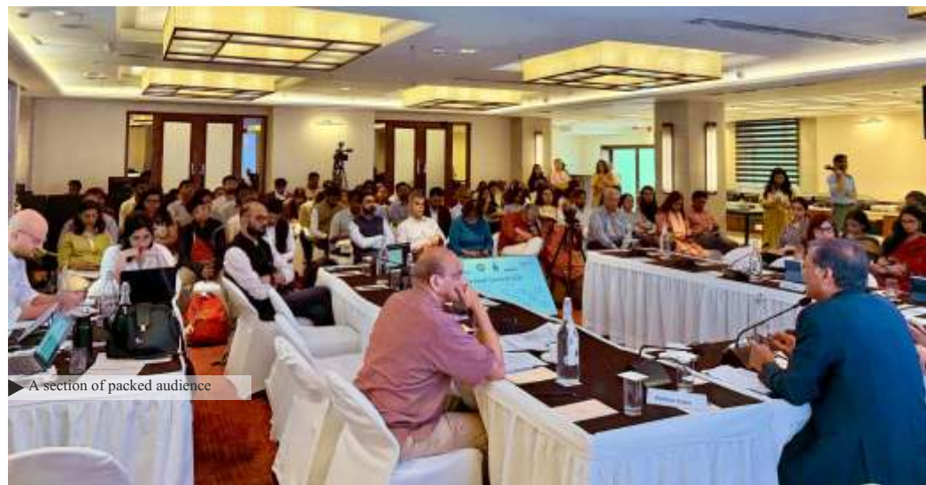
A section of packed audience