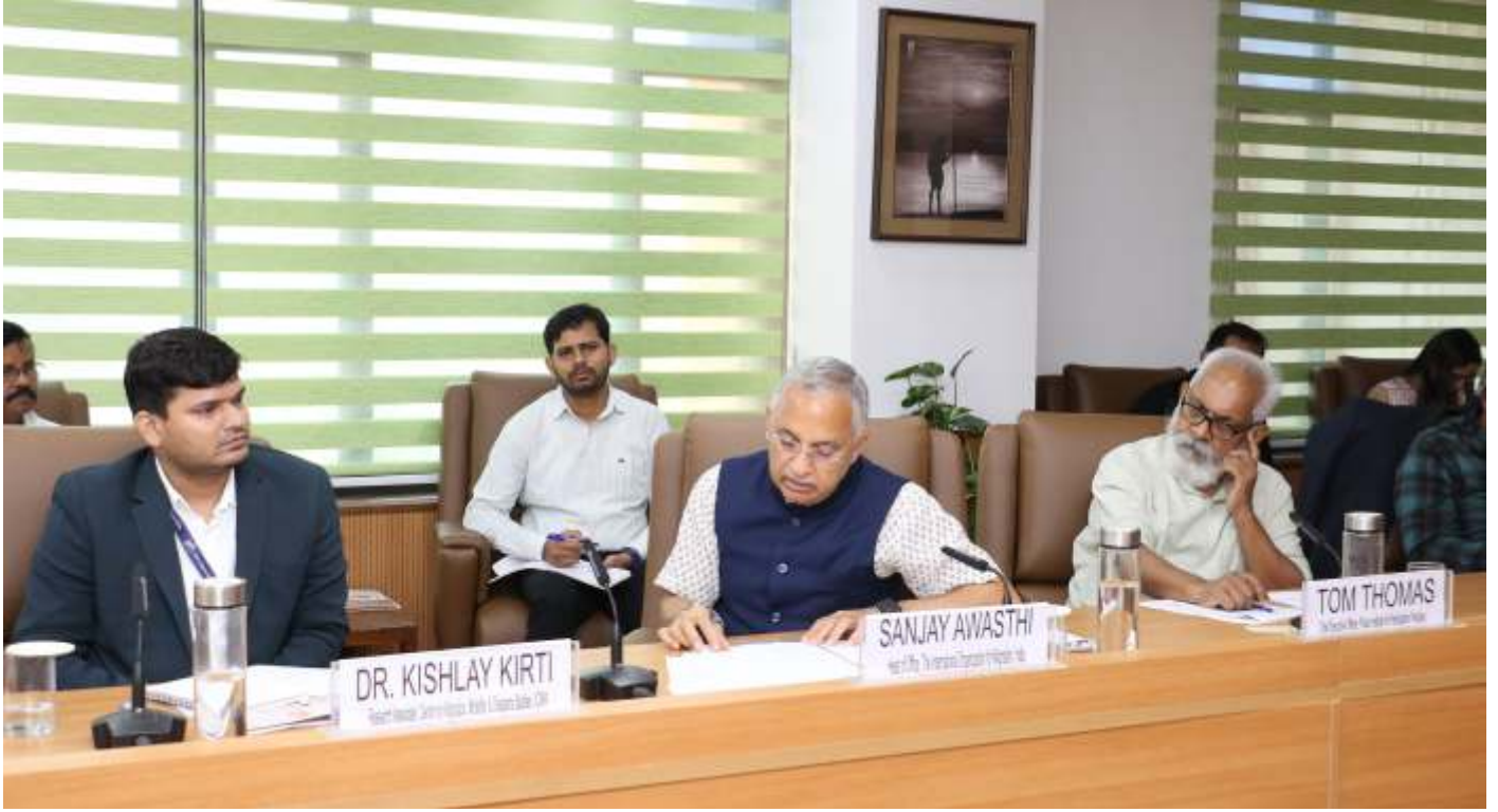
► प्रतिभागियों का एक वर्ग