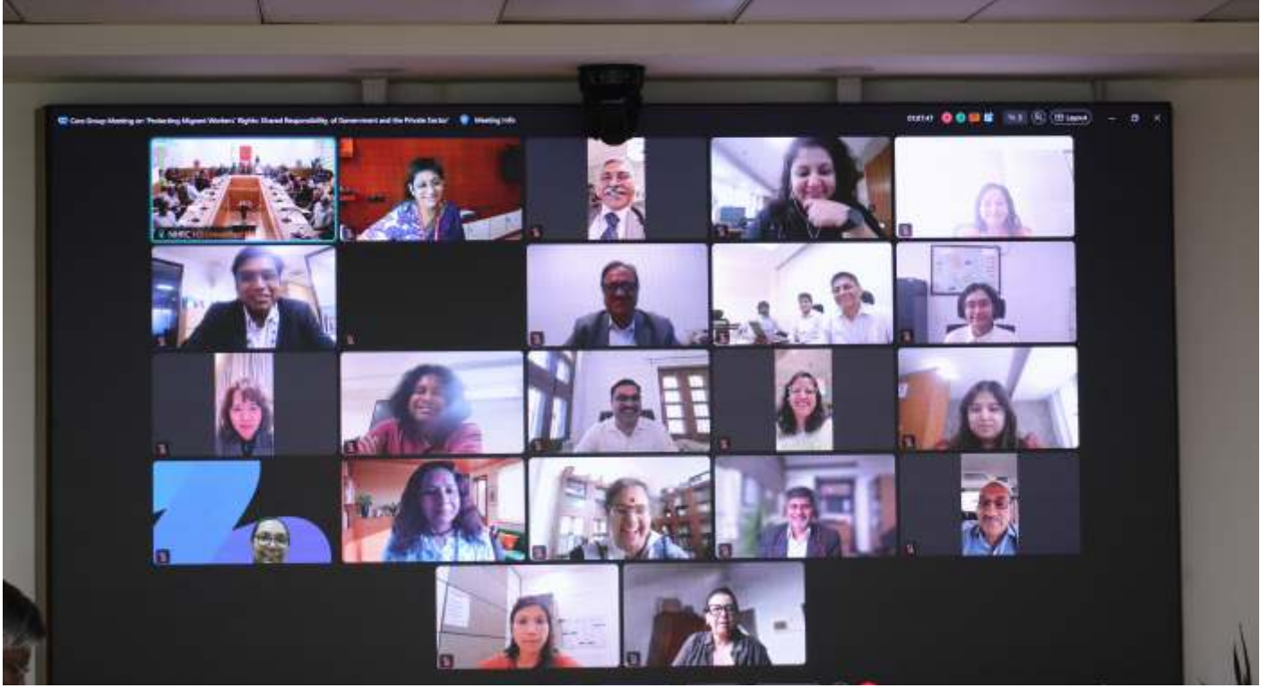
► उपस्थित लोगों का एक वर्ग

पर प्रकाश डाला। उन्होंने कहा कि हालांकि भारत में 1979 से प्रवासी श्रमिक सुरक्षा सहित मजबूत श्रम कानून हैं, लेकिन कार्यान्वयन एक चिंता का विषय बना हुआ है। उन्होंने कहा कि प्रवासी श्रमिकों द्वारा सामना की जाने वाली समस्याएं व्यापक रूप से ज्ञात हैं और आयोग अपेक्षा करता है कि बहु-हितधारक चर्चाओं के परिणामस्वरूप कार्यान्वयन के लिए केंद्र और राज्य सरकारों को सिफारिशों के रूप में व्यावहारिक समाधान सुझाए जाएं।