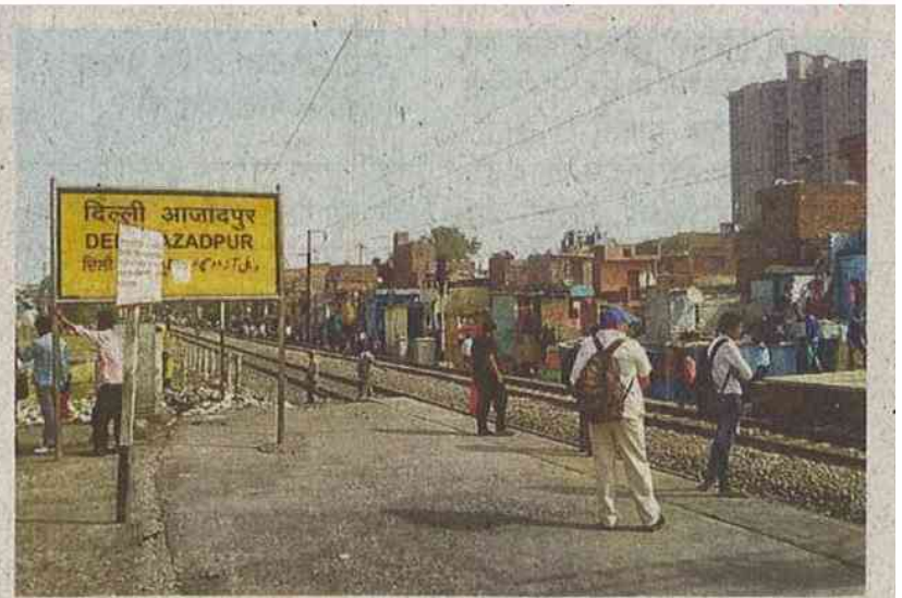
आजादपुर रेलवे स्टेशन, जहां अन्य रास्ते से भी यात्री स्टेशन में प्रवेश करते हैं •

लोगों ने रोहतक के एक व्यापारी को घेरकर उनके बैग से जेवर निकाल लिए थे, ठक-ठक गैंग के सदस्य थे आरोपित