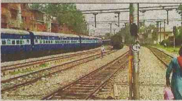
सदर बाजार रेलवे स्टेशन, जहां से ट्रेन के चलने के बाद लुटेरों ने वारदात को दिया अंजाम •

03 किलो से ज्यादा भार के थे सोने के गहने