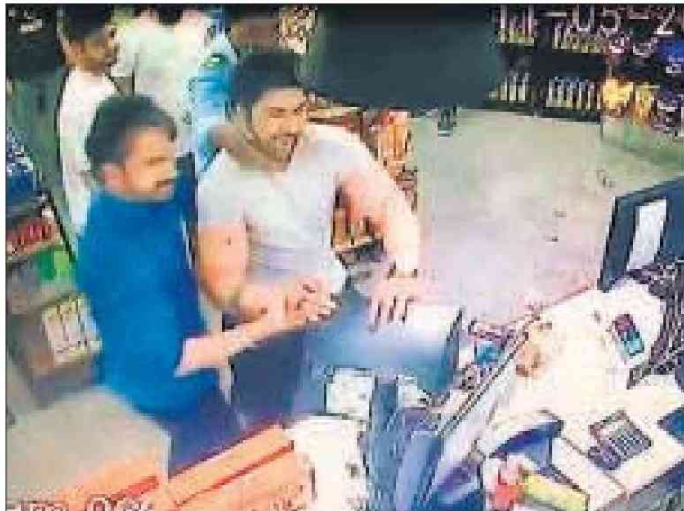
■ CCTV footage shows actor Aansh Arora vandalising a store inside a Vaishali mall.

The Ghaziabad police on Saturday released several CCTV footages from inside the store purportedly showing Arora damaging equipment inside the store.