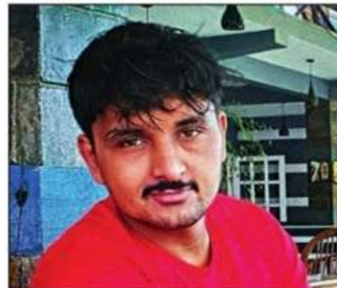
The alleged henchmen — Sunny, Ashish and Vicky — were hit several times by police shooters

man named Ajay was killed by Delhi Police during a shootout in a Fusion car showroom in west Delhi's Tilak Nagar. Bhau had claimed at the time on Instagram that police had picked Ajay up from Mount Abu and killed him in cold blood. NHRC is looking