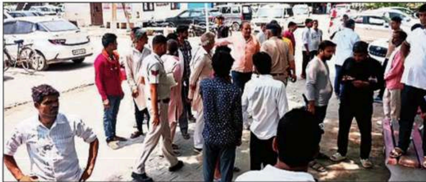
Family members of three men killed in a police encounter in Sonipat