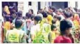
एजेसी ५५ मुर्शिदाबाद/मालदा

मालदा में हिंसा पीड़ित लोगों से की मुलाकात और बोल मालदा मुर्शिदाबाद। पश्चिम बंगाल के मुर्शिदाबाद में हिंसा से अब भी पूरे प्रदेश में जमकर सियासत गरम है। प्रदेश के राज्यपाल सीबी आनंद बोस हिंसा पीड़ितों से मिलने मालदा पहुंचे। वे ट्रेन से गए। बोस ने हिंसा प्रभावित क्षेत्रों में पीड़ितों से मुलाकात से पहले यह बयान दिया। मुर्शिदाबाद में हिंसा को लेकर बोस ने सख्त रुख अपनाया है। हिंसा प्रभावित लोग शिविरों में रहने को मजबूर हैं। इस दौरान उन्होंने कहा कि बंगाल में जगह-जगह हिंसा अपना भयानक रूप दिखा रही है।