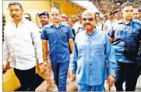
मालदा टाउन स्टेशन पर ट्रेन से उतरने के बाद पीड़ितों से मिलने जाते राज्यपाल.