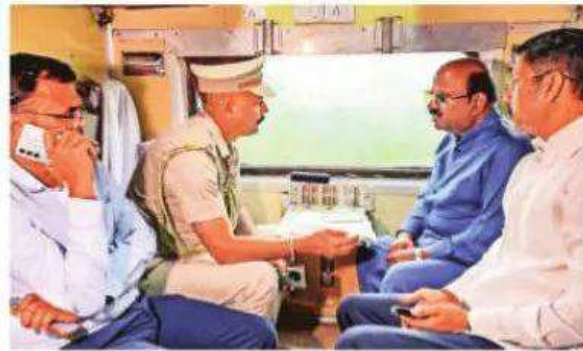
Bengal Governor CV Ananda Bose on a train to Malda, Friday.

"They told me that goons entered their homes, assaulted them and their family members, looted, and then set fire to their houses. They all said they want to return to their homes. But they sought protection. They want a secure environment," the Governor told mediapersons. "They need new houses as their homes have been reduced to ashes and ransacked. They want