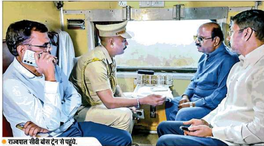
● राज्यपाल सीवी बोस ट्रेन से पहुंचे।

राज्यपाल ने कहा कि वे पीड़ितों से मिलकर जमीनी स्थिति समझेंगे और केंद्र सरकार को रिपोर्ट देंगे। उन्होंने कहा, हमें हिंसा के रास्ते को खत्म करना होगा और उसके ताबूत में आखिरी कील ठोकनी होगी।