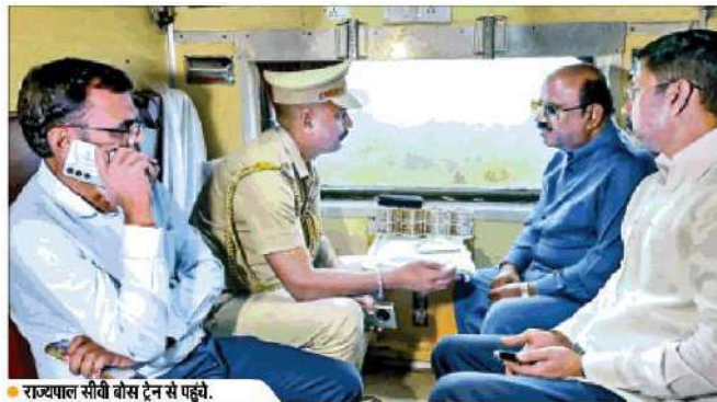
● राज्यपाल सीवी बोस ट्रेन से पहुंचे,

राज्यपाल ने कहा कि वे पीड़ितों से मिलकर जमीनी स्थिति समझेंगे और केंद्र सरकार को रिपोर्ट देंगे, उन्होंने कहा, हमें हिंसा के रास्ते को खत्म करना होगा और उसके तात्कालिक में आखिरी कोल ठोकनी होगी,