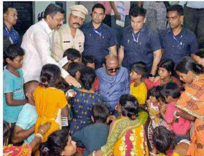
Taking stock: C.V. Ananda Bose meets the displaced families at a shelter home in Malda on Friday.

"The purpose of my visit is to establish normalcy