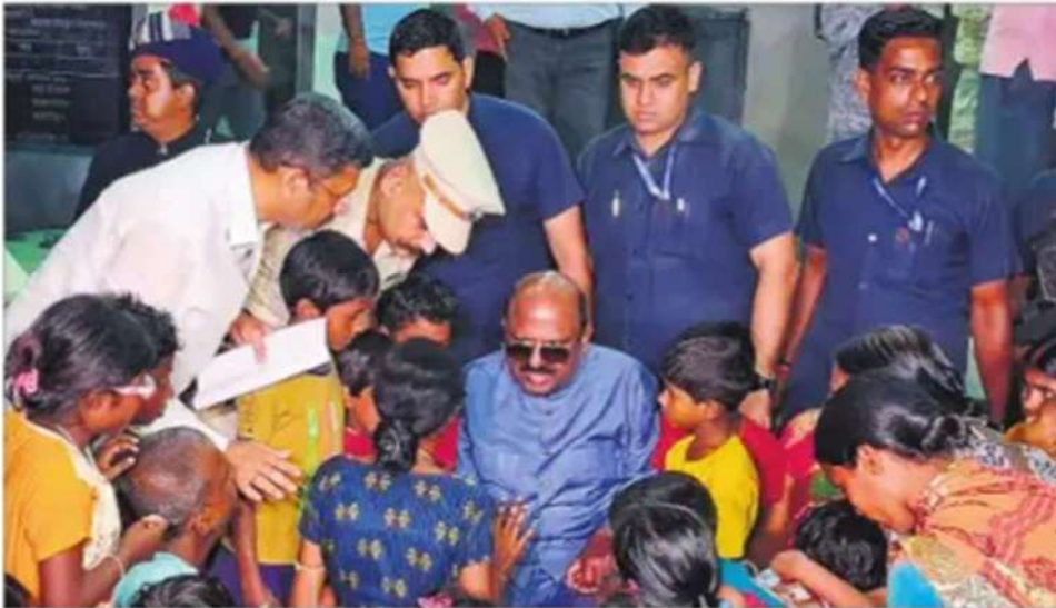
Bengal Governor CV Ananda Bose meets families affected by the Murshidabad violence in Malda on Friday.

NHRC, NCW teams visit Malda relief camps