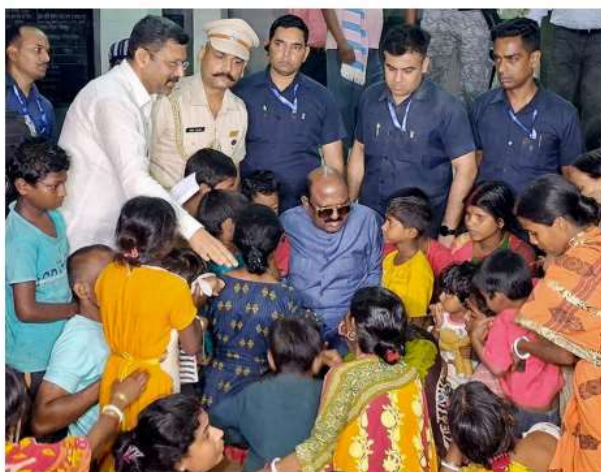
Taking stock: C.V. Ananda Bose meets the displaced families at a shelter home in Malda on Friday.

"The purpose of my visit is to establish normalcy