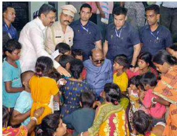
Taking stock: C.V. Ananda Bose meets the displaced families at a shelter home in Malda on Friday.

"The purpose of my visit is to establish normalcy