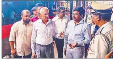
NHRC team arrives at Malda station to meet people who have taken shelter in a temporary refugee camp after fleeing violence-hit areas of Murshidabad district in Malda district on Friday. (R) Governor CV Ananda Bose arrives at Malda to visit violence-affected people. (PTI)

During the Governor's visit, inmates of the Parlapur High School relief camp in Baishnabnagar, Malda — where few hundreds have taken shelter since the April 11-12 clashes — staged protests alleging "police-imposed censorship, denial of access to visitors and inhumane living conditions".