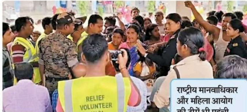
अस्थायी शिविर में प्रभावितों से बात करते आयोग के सदस्य।