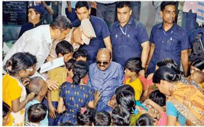
बंगाल के मालदा में शुक्रवार को राज्यपाल सीवी आनंद बोस ने मुर्शिदाबाद हिंसा पीड़ितों से मिलकर उनकी व्यथा सुनी

राज्य ब्यूरो, जागरण, कोलकाता : बंगाल के राज्यपाल सीवी आनंद बोस ने मुख्यमंत्री ममता बनर्जी के विरोध के बाद भी शुक्रवार को मालदा के वैष्णवनगर स्थित पार लालपुर स्कूल का दौरा किया व मुर्शिदाबाद हिंसा के पीड़ित शरणार्थियों से बात की। पीड़ितों से मुलाकात के बाद राज्यपाल ने कहा कि बंगाल की में दो बड़ी समस्याएं पनप रही हैं, हिंसा और भ्रष्टाचार, जिन्हें बर्दाश्त नहीं किया जाएगा। इन समस्याओं की जड़ तक पहुंचकर इन्हें खत्म करना होगा। राज्यपाल शनिवार को मुर्शिदाबाद के हिंसाग्रस्त इलाकों का दौरा करेंगे। उधर, राष्ट्रीय मानवाधिकार आयोग (एनएचआरसी) व राष्ट्रीय महिला आयोग (एनसीडब्ल्यू) की टीम ने शुक्रवार को मालदा के वैष्णवनगर स्थित पार लालपुर स्कूल का दौरा किया और विस्थापित लोगों से बात की।