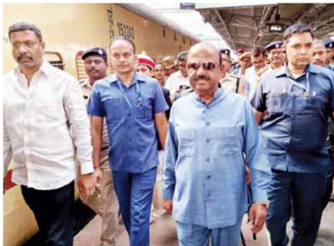
West Bengal Governor CV Ananda Bose arriving at Malda Town railway station to visit a relief camp to meet those displaced by the violence that erupted during a protest against the Waqf (Amendment) act, 2025 in Malda on Friday

"I would request non-locals not to visit Murshidabad right now. I would appeal to the Governor to wait for a few more days as confidence-building measures are underway... I could have gone there ... but I desisted because I want the peace to