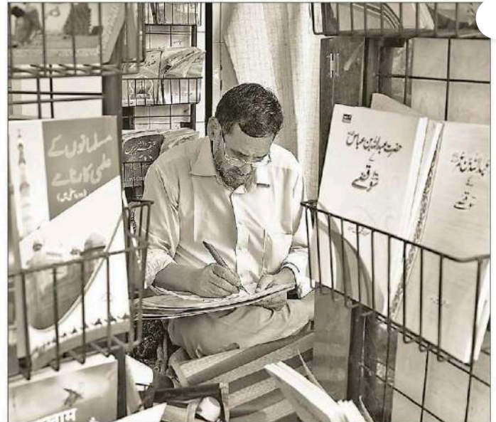
Under a provision in Part VIII of the Constitution, the Union government is authorised to ensure the recognition of a minority language for official use in any state.