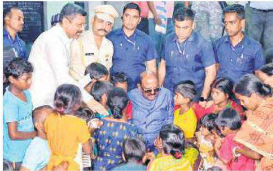
West Bengal Governor CV Ananda Bose meets the families affected by the Murshidabad violence at a shelter home in Malda on Friday

The visits triggered political squabbling with TMC alleging that they were aimed at stoking tension in the already-volatile region. "When the CM had requested him to delay the visit, the governor should have honoured that. His actions show an intent to cre-