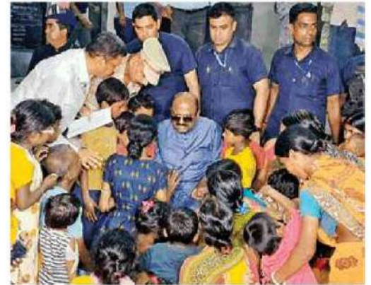
मालदा में शुक्रवार को राज्यपाल सीवी आनंद बोस ने मुर्शिदाबाद हिंसा के पीड़ितों से मिलकर उनकी व्यथा सुनी

राज्यपाल सीवी आनंद बोस ने भी शुक्रवार को मालदा के वैष्णवनगर स्थित पार लालपुर स्कूल का दौरा किया व मुर्शिदाबाद हिंसा के पीड़ित शरणार्थियों से बात की। पीड़ितों से मुलाकात के बाद राज्यपाल ने कहा कि बंगाल में दो बड़ी समस्याएं पनप रही हैं, हिंसा और भ्रष्टाचार, जिसे बर्दाश्त नहीं किया जाएगा। राज्यपाल बोस ने कहा कि वह पूरी स्थिति पर नजर रखे हुए हैं और राज्य और केंद्र सरकार के साथ लगातार संपर्क में हैं। कहा कि हम शांति और सामान्य स्थिति को स्थापित करने के लिए हरसंभव कदम उठाएंगे। केंद्रीय बलों की तैनाती के बाद से शिकायतों में काफी कमी आई है। कोशिश की जाएगी कि बीएसएफ यहां तीन महीने तक रहे। राहत कार्य में तेजी लाने के लिए अंतरराष्ट्रीय संगठन रेड क्रॉस से समर्थन का अनुरोध किया है। राज्यपाल शनिवार को मुर्शिदाबाद के हिंसाग्रस्त इलाकों का दौरा करेंगे।