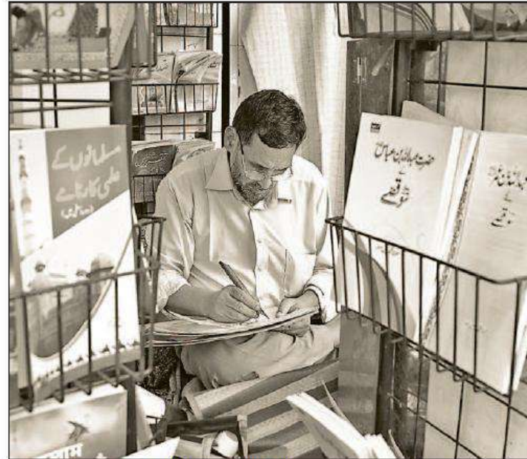
Under a provision in Part VIII of the Constitution, the Union government is authorised to ensure the recognition of a minority language for official use in any state.