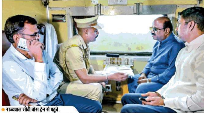
● राज्यपाल सीवी बोस ट्रेन से पहुंचे।

राज्यपाल ने कहा कि वे पीड़ितों से मिलकर जमीनी स्थिति समझेंगे और केंद्र सरकार को रिपोर्ट देंगे। उन्होंने कहा, हमें हिंसा के रास्ते को खत्म करना होगा और उसके ताबूत में आखिरी कील ठोकनी होगी।