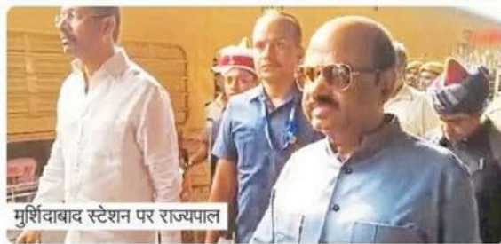
मुर्शिदाबाद स्टेशन पर राज्यपाल

केंद्रीय बल तैनात करने का निर्देश दिया था। खंडपीठ ने कहा कि, मुर्शिदाबाद में शांति बहाल करना अदालत का कार्य है और जब तक वहां शांति स्थापित नहीं होती, केंद्रीय बल वहां मौजूद रहेंगे। खंडपीठ ने यह भी कहा कि हिंसा में जिन लोगों को क्षति पहुंची है, उनका पुनर्वास और