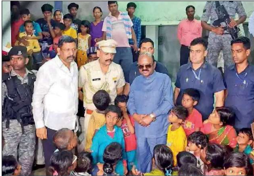
पश्चिम बंगाल के राज्यपाल सी.वी. आनंद बोस शुक्रवार को मालदा पहुंचे। वक्फ कानून के खिलाफ विरोध प्रदर्शन के दौरान भड़की हिंसा से विस्थापित हुए लोगों से मिलने के लिए एक राहत शिविर का दौरा भी किया।

राज्यपाल बोले, हमारा उद्देश्य समाज में शांति स्थापित करना