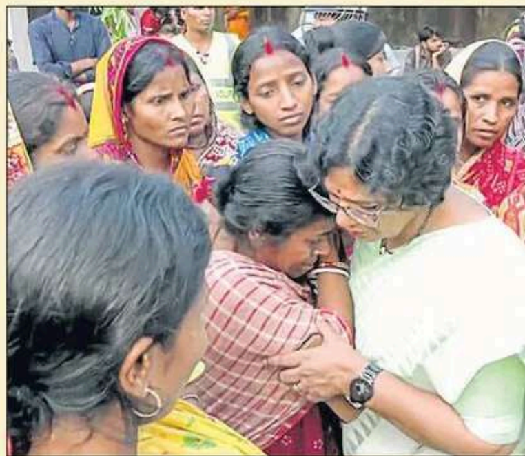
मालदा में हिंसा प्रभावितों से शुक्रवार को महिला आयोग की टीम भी मिलने पहुंची।

06 के करीब लोगों की मौत मुर्शिदाबाद में दो दिन हुई हिंसा में हुई थी