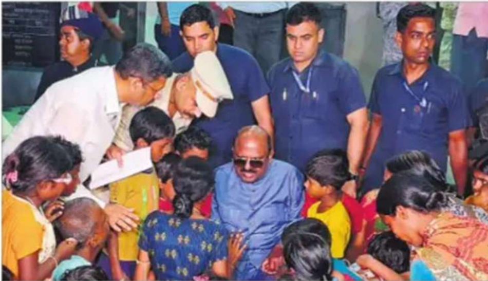
Bengal Governor CV Ananda Bose meets families affected by the Murshidabad violence in Malda on Friday.

NHRC, NCW teams visit Malda relief camps