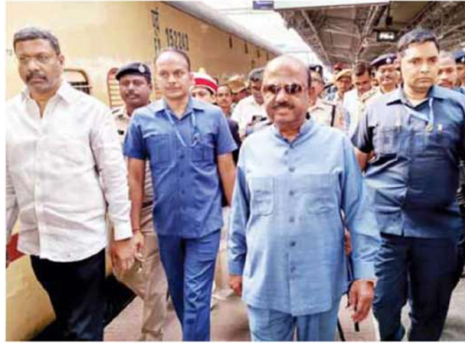
West Bengal Governor CV Ananda Bose arriving at Malda Town railway station to visit a relief camp to meet those displaced by the violence that erupted during a protest against the Waqf (Amendment) act, 2025 in Malda on Friday

"I would request non-locals not to visit Murshidabad right now. I would appeal to the Governor to wait for a few more days as confidence-building measures are underway... I could have gone there... but I desisted because I want the peace to