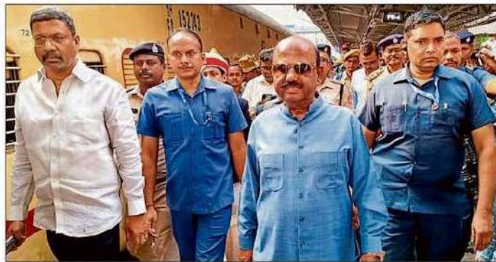
West Bengal Governor CV Ananda Bose arrives at the Malda Town railway station on Friday.

Teams from the National Human Rights Commission (NHRC) and National Commission for Women (NCW) on Friday visited the Parlapur High School relief camp in Baishnabnagar, Malda, to meet the Murshidabad riot vic-