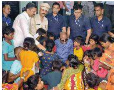
Taking stock: C.V. Ananda Bose meets the displaced families at a shelter home in Malda on Friday.

"The purpose of my visit is to establish normalcy