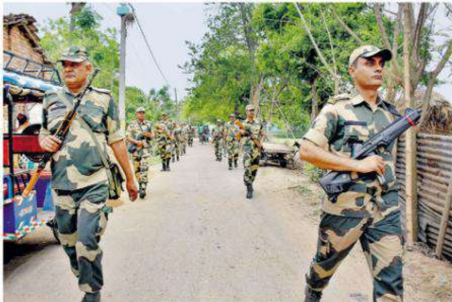
Security personnel keep vigil after violence in Murshidabad in which three people were killed.

Despite Chief Minister Mamata Banerjee requesting him to postpone his visit to the violence-hit Murshidabad dis-