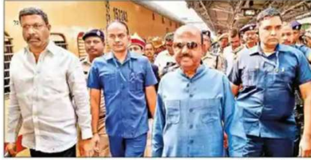
कोलकाता स्टेशन पर पत्रकारों से बात करते प बंगाल के राज्यपाल सीवी आनंद बोस.

पश्चिम बंगाल के मुर्शिदाबाद में हिंसा को लेकर राज्यपाल सीवी आनंद बोस ने सख्त रुख अपनाया है. उन्होंने कहा है कि मुर्शिदाबाद या मालदा में हुई हिंसा को कभी बर्दाश्त नहीं किया जा सकता. बोस ने हिंसा प्रभावित क्षेत्रों में पीड़ितों से मुलाकात से पहले यह बयान दिया. इसके बाद राज्यपाल मालदा पहुंचे. यहाँ उन्होंने राहत शिविर में जाकर हिंसा के पीड़ितों से मुलाकात की. राज्यपाल के राहत शिविर में पहुंचते ही अफरा-तफरी मच गयी. स्थानीय लोग राज्यपाल से मिलना चाहते