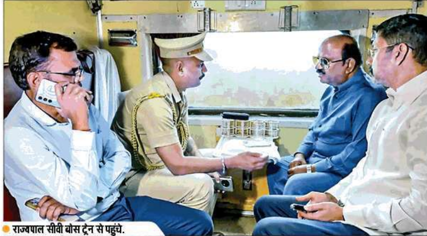
● राज्यपाल सीवी बोस ट्रेन से पहुंचे।

राज्यपाल ने कहा कि वे पीड़ितों से मिलकर जमीनी स्थिति समझेंगे और केंद्र सरकार को रिपोर्ट देंगे। उन्होंने कहा, हमें हिंसा के रास्ते को खत्म करना होगा और उसके ताबूत में आखिरी कील ठोकनी होगी।