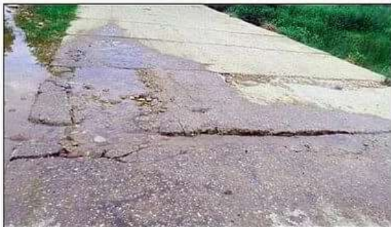
विजयपुर नगरोटा मार्ग इस तरह से खस्ताहाल हो गया है। संवाद

नगरोटा मार्ग की खस्ता हालत से जनता परेशान