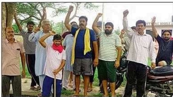
गाय की मौत पर बिजली विभाग के खिलाफ नारेबाजी करते लोग।