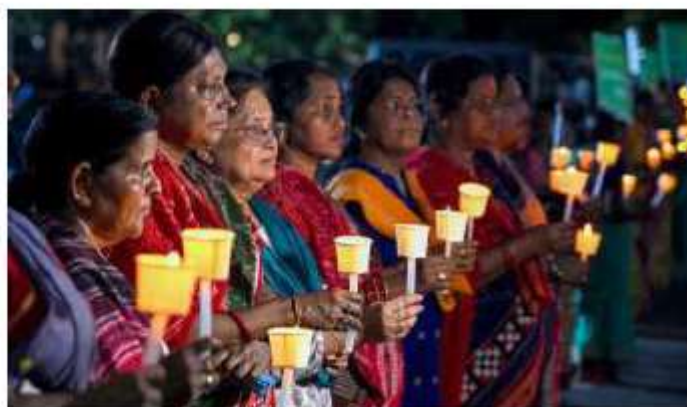
Outpouring of grief: Women activists holding a candlelight vigil in Bhubaneswar for the student. BISWARANJAN ROUT

"Those who were supposed to protect her were the ones who broke her spirit. As always, the BJP system shielded the accused – and pushed an innocent girl to the point where she set herself on fire. This is not suicide; it is a murder orchestrated by the system," he said.