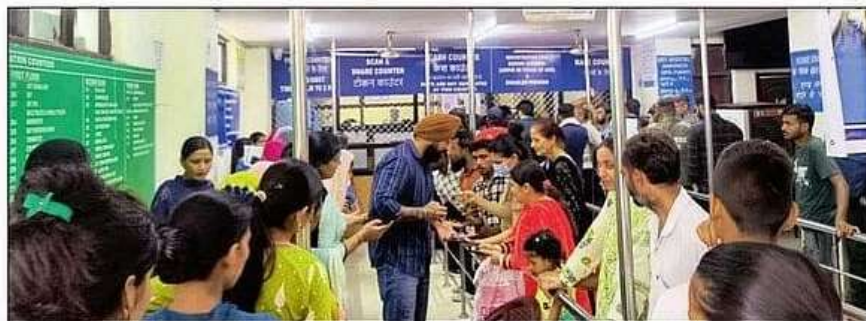
गांधीनगर अस्पताल के टोकन काउंटर पर पंजीकरण के लिए कर्मचारी के पास खड़े मरीज व तीमारदार। अमर उजाला

यहां पहली चुनौती वेंटिलेशन की है। उमस भरी गर्मी में वहां खड़े रहने में दिक्कत आती है। पंखे तो हैं लेकिन ज्यादा राहत नहीं देते हैं। कूलर खराब