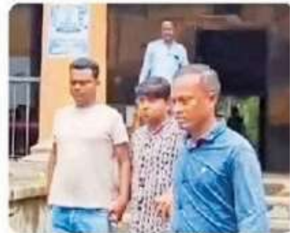
आरोपी शिक्षक को अदालत से जेल ले जाती पुलिस

फिलहाल पुलिस मामले की तहकीकात कर रही है और पीड़ित बच्चों के बयान के साथ-साथ अन्य छात्रों और स्कूल स्टाफ से पूछताछ की जा रही है। गिरफ्तारी के विरोध में छात्रों और अभिभावकों का एक समूह चंदननगर थाने के बाहर जुटा रहा। उनका दावा है कि शिक्षक को षड्यंत्र के तहत फंसाया गया है