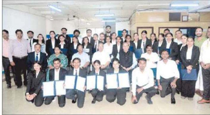
MP Human Rights Commission concludes internship; students awarded certificates on July 15.

For practical experience, the students visited various institutions such as police stations, juvenile correctional homes, the forensic department of AIIMS, the National Judicial Academy, and the Central Jail.