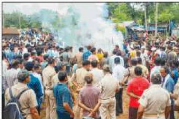
बालासोर : पुलिस की मौजूदगी में छात्रा का किया जा रहा अंतिम संस्कार।

भुवनेश्वर, 15 जुलाई (प.स.): एक शिक्षक द्वारा कथित तौर पर 'यौन उत्पीड़न' किए जाने के मामले में न्याय न मिलने पर आत्मदाह करने वाली 20 वर्षीय कॉलेज छात्रा ने यहां अखिल भारतीय आयुर्विज्ञान संस्थान (एम्स) में दम तोड़ दिया, जिससे बवाल मच गया है। राज्य में कई जगहों पर प्रदर्शन किए गए। कांग्रेस और माकपा ने इसे सामाजिक न्याय और महिला सुरक्षा के प्रति भाजपा सरकार की नाकामी बताई। कांग्रेस ने इस घटना के विरोध में 17 जुलाई को पूरे राज्य में बंद की कॉल दी है।