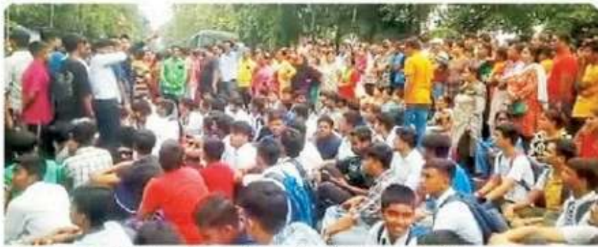
चंदन नगर थाने के सामने प्रदर्शन करते अभिभावक के और छात्र

घटना के बाद छात्रों के परिजनों ने चंदननगर थाने में लिखित शिकायत दर्ज कराई, जिसके बाद पुलिस ने तत्काल कार्रवाई करते हुए आरोपी शिक्षक को गिरफ्तार कर लिया। आरोपी को चंदननगर महकमा अदालत में पेश किया गया, जहां से उसे 14 दिनों की न्यायिक हिरासत में भेजने का निर्देश दिया गया। हालांकि, गिरफ्तारी के बाद विवाद उस वक्त बढ़ गया जब स्कूल के अन्य छात्रों ने शिक्षक पर लगे आरोपों को 'झूठा' बताते हुए उसकी अविलंब रिहाई की मांग की। विरोध कर रहे छात्रों ने चंदननगर थाने के