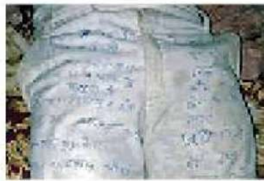
पैंट पर लिखा सुसाइड नोट • जागरण

जासं, फर्रुखाबाद: हथियापुर चौकी में पुलिस की पिटाई से आहत युवक ने सोमवार रात फंदा लगाकर जान दे दी। स्वजन का आरोप है कि घरेलू कलह में पत्नी की शिकायत पर पुलिस युवक व उसके पिता को चौकी ले गई, जहां पुलिसकर्मियों ने गाली-गलौज कर युवक की पिटाई की। छोड़ने के एवज में 40 हजार रुपये रिश्वत भी ली। इससे आहत होकर उसने आत्मघाती कदम उठा लिया। उसने अपनी पैंट पर सुसाइड नोट लिखा, जिसमें ससुरालीजन सहित एक जनप्रतिनिधि के करीबी व दो सिपाहियों पर प्रताड़ित करने के आरोप लगाए हैं। मामले में दो सिपाहियों सहित पांच लोगों के खिलाफ मुकदमा दर्ज किया गया है। एसपी ने दोनों सिपाहियों को लाइन हाजिर भी कर दिया है।