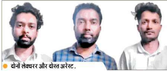
● दोनों लेक्चरर और दोस्त अरेस्ट.

पीड़िता की शिकायत पर तीनों आरोपियों को गिरफ्तार कर लिया गया है. मराठाहल्ली थाने में उनके खिलाफ दुष्कर्म, आपराधिक धमकी, ब्लैकमेलिंग और POCSO एक्ट